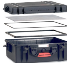
[ HPRPCPF-006-01 ]

[ México D.F ] 55.8851.8726 - 55.8851.8725 [ Querétaro ] 442.234.1610 - 442.234.1338 www.harderback.com