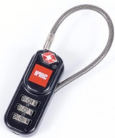
[ HPRCLO ]