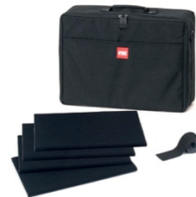
[ HPRCBAG2500-01 ]