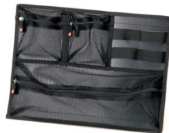
[ HPRCORG-003-01 ]