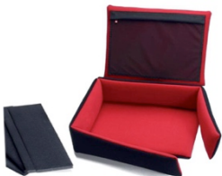
[ HPRCSFD2500-01 ]